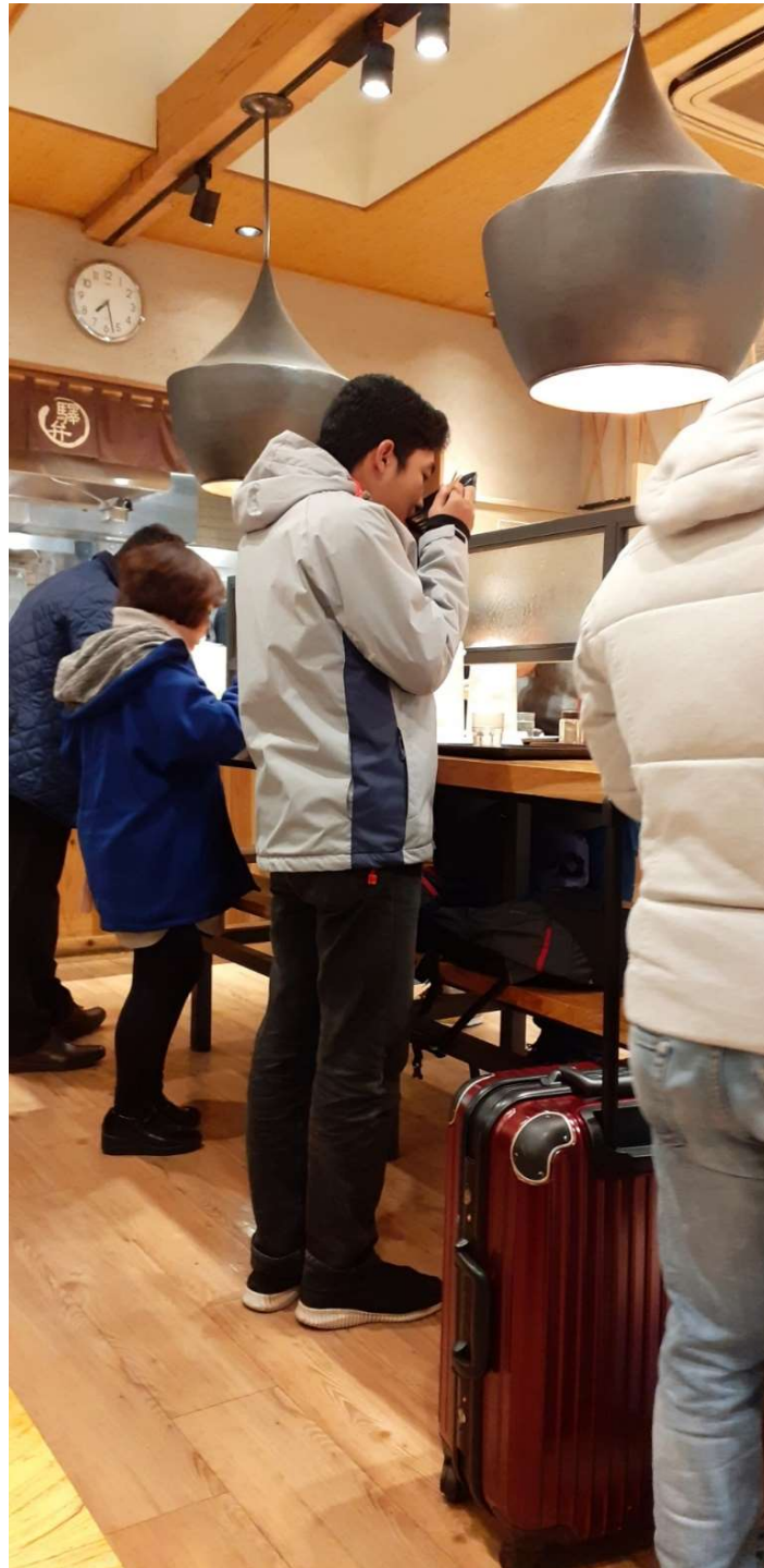
Udon....halal insya Allah