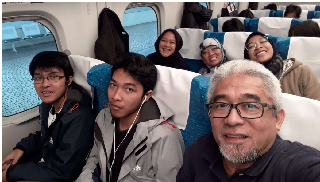
Naik shinkansen ...ini juga jadi target ke Jepang, naik bullet train.....luar biasalah....