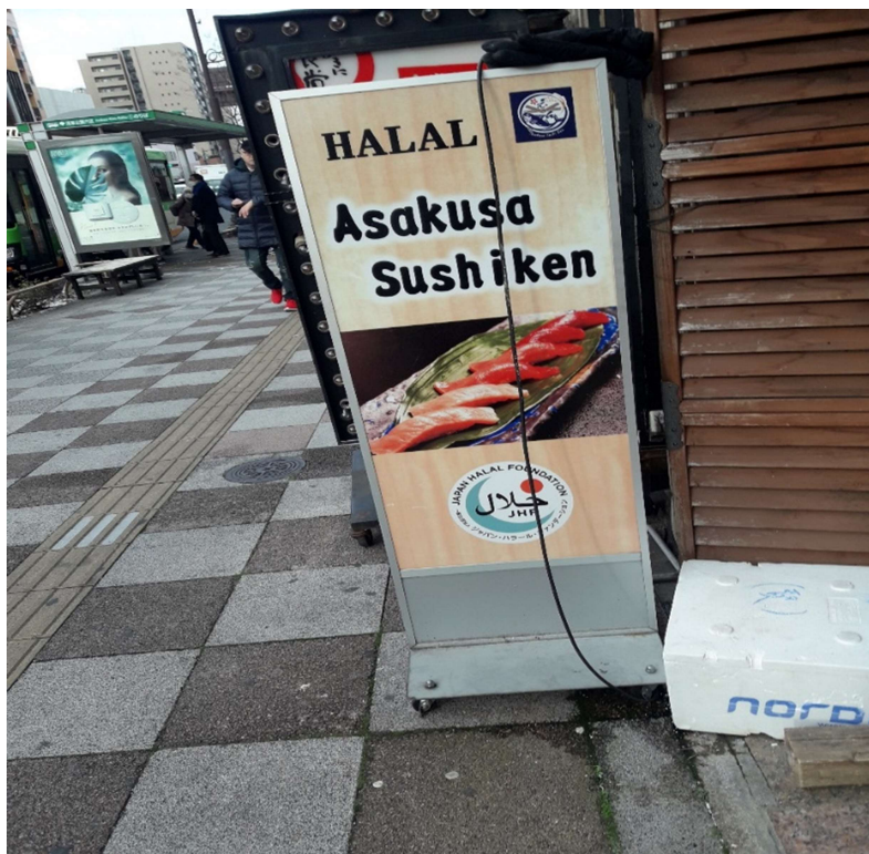
Asakusa Sushi Ken nama restonya

Abis keliling – keliling laper lagi. Kali ini mau coba Sushi di Asakusa yang direkomendasiin di Tripadvisor.