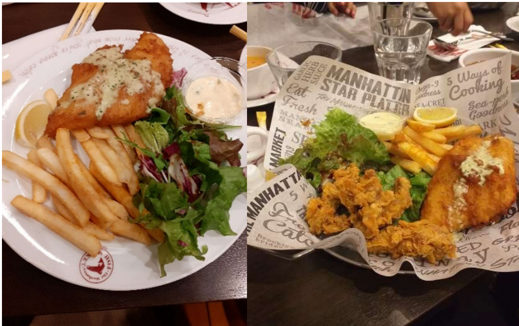
Fish and potato....luar biasa, umai naaaaa.....