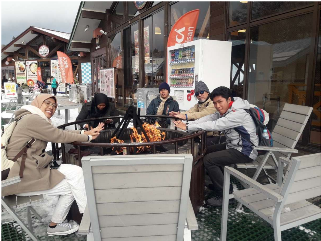
Akhirnye kesampaian juga maen salju.....