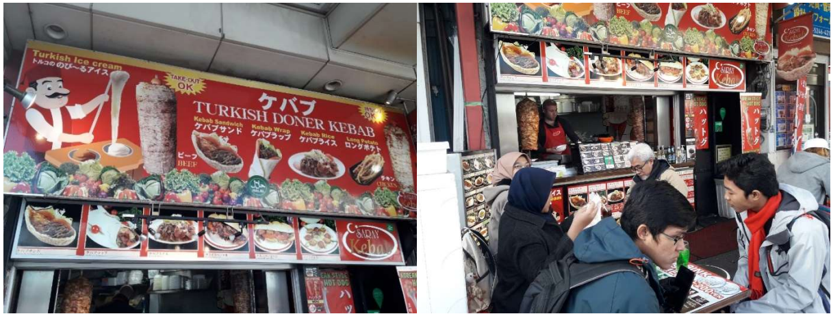
Resto kebab Turki ini dekat dengan Asakusa ginza (Sensoji).....pas pinggir jalan

Lanjut.....Keliling – keliling Asakusa .....again. Dapet harta karun lumayan banyak. Ada kaos, gantungan kunci, kaos kaki, payung samurai, koper sampe obat buat kakek dan omiyage buat teman – teman sekolah.