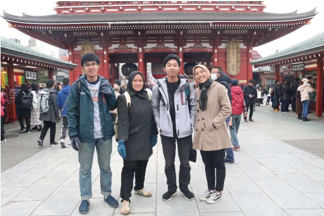
Sensoji....ini Ginza tua dan terkenal di Asakusa-Tokyo