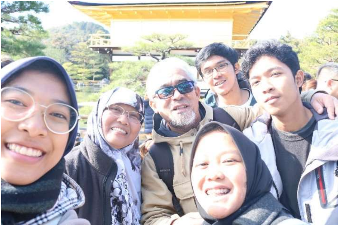
Spot ini harus rebutan dg turis lain.....