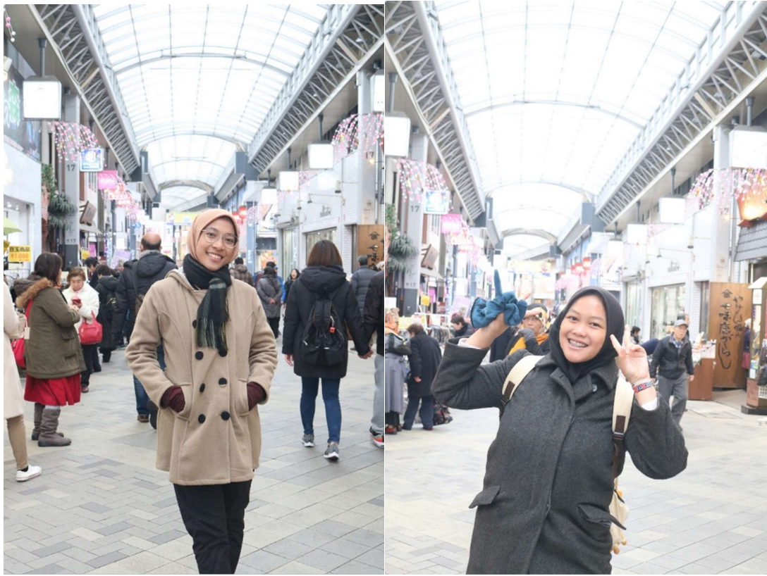
Dinner terakhir di Jepun dg sushi yg dibeli di toko DAEI dekat apartemen, pas lg ada diskon, Alhamdulillah