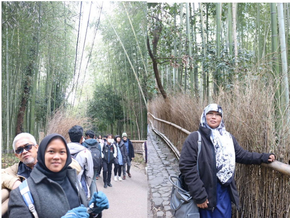
Agak beda sih dengan bamboo yang ada di Indonesia

Abis makan balik lagi ke Sta Emmachi terus bablas deh ke Stasiun Saga Norikyu....tujuannya adalah Bamboo Forest (Takemori) di daerah Arashiyama....sampe stasiun jalan kaki....kirain dekat....alamak ...sumpah jaauuuuhhh....akhirnya sampe bamboo Forest udah kecapean....nggak ikutan nanjak deh...lagipula ada perayaan di Kuil Tenryakuji untuk mereka - mereka yang berusia 20 tahun.....ramee pake banget.....n guys....ada yang lucu dong....Bahasa Indonesia berseliweran di sini.....jadi berasa di kampung sendiri