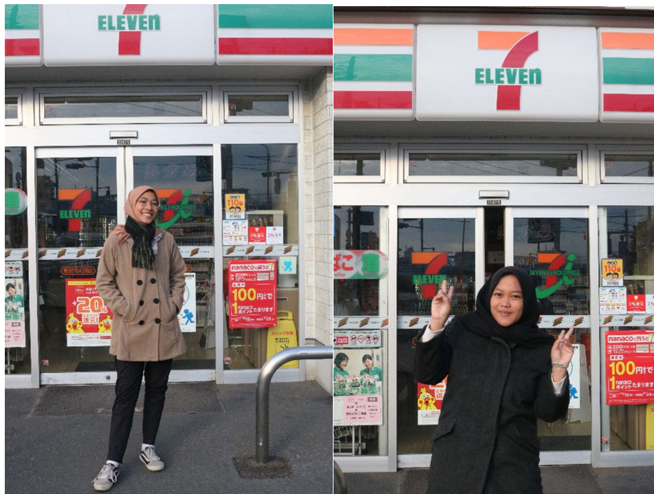
Bergayalah di depan seven eleven