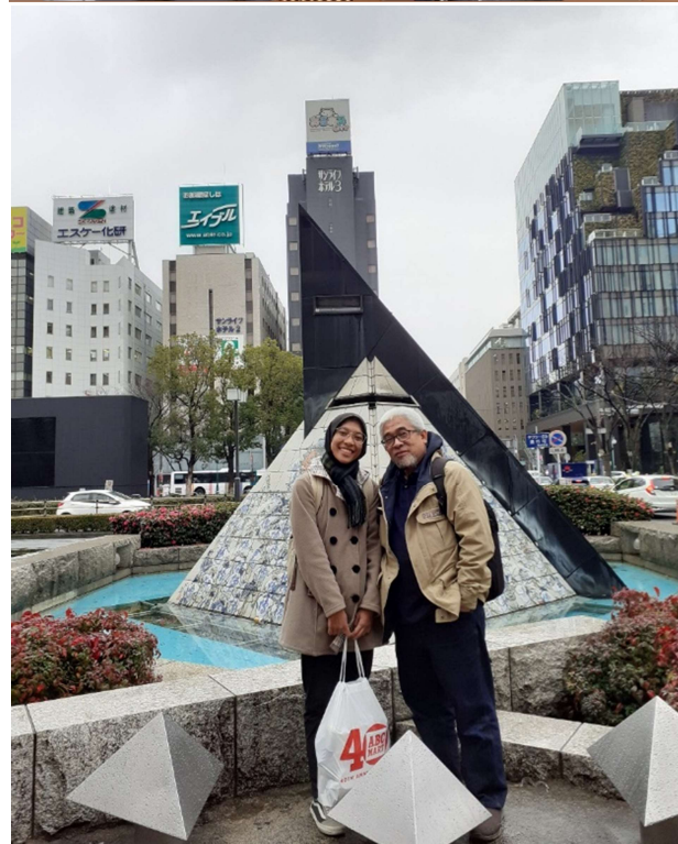
Hisashiburi ne Hakata eki.....Hakata eki ini stasiun kereta terbesar di Fukuoka