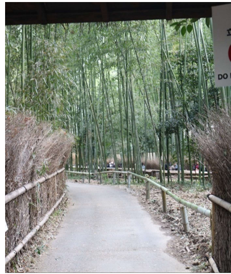
Luar bisa tertata rapih dan bersih.....