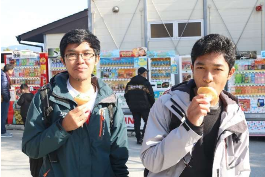
Justeru musim dingin ...terasa nikmatnya ice cream rasa gree tea.....oishi neeee