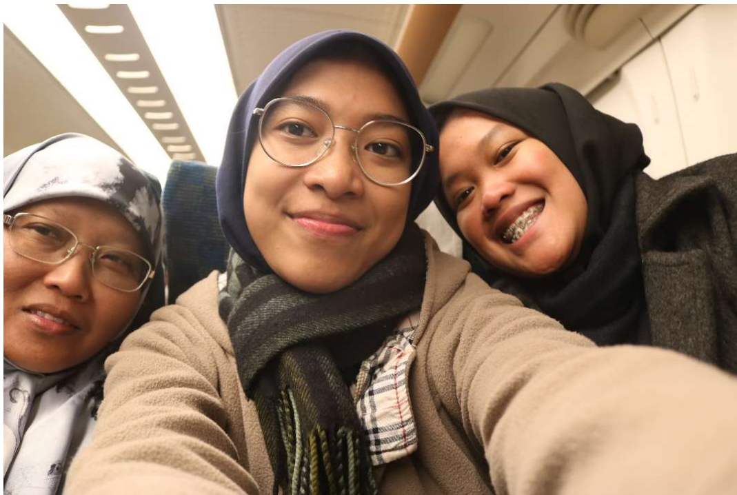
Shinkansen hikari.....kagak terasa, padahal kecepatannya sekitar 284 kph.