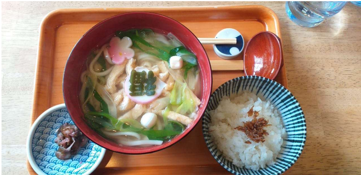
Ini udon enak bener....jauh deh marugame udon margo mah....

Abis makan balik lagi ke Sta Emmachi terus bablas deh ke Stasiun Saga Norikyu....tujuannya adalah Bamboo Forest (Takemori) di daerah Arashiyama....sampe stasiun jalan kaki....kirain dekat....alamak ...sumpah jaauuuuhhh....akhirnya sampe bamboo Forest udah kecapean....nggak ikutan nanjak deh...lagipula ada perayaan di Kuil Tenryakuji untuk mereka - mereka yang berusia 20 tahun.....ramee pake banget.....n guys....ada yang lucu dong....Bahasa Indonesia berseliweran di sini.....jadi berasa di kampung sendiri