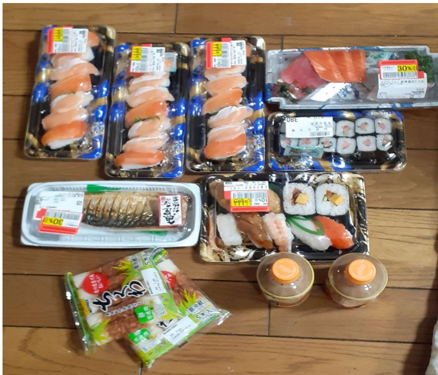
Oishikatte nee....diskon lagi....mantabbbbbb