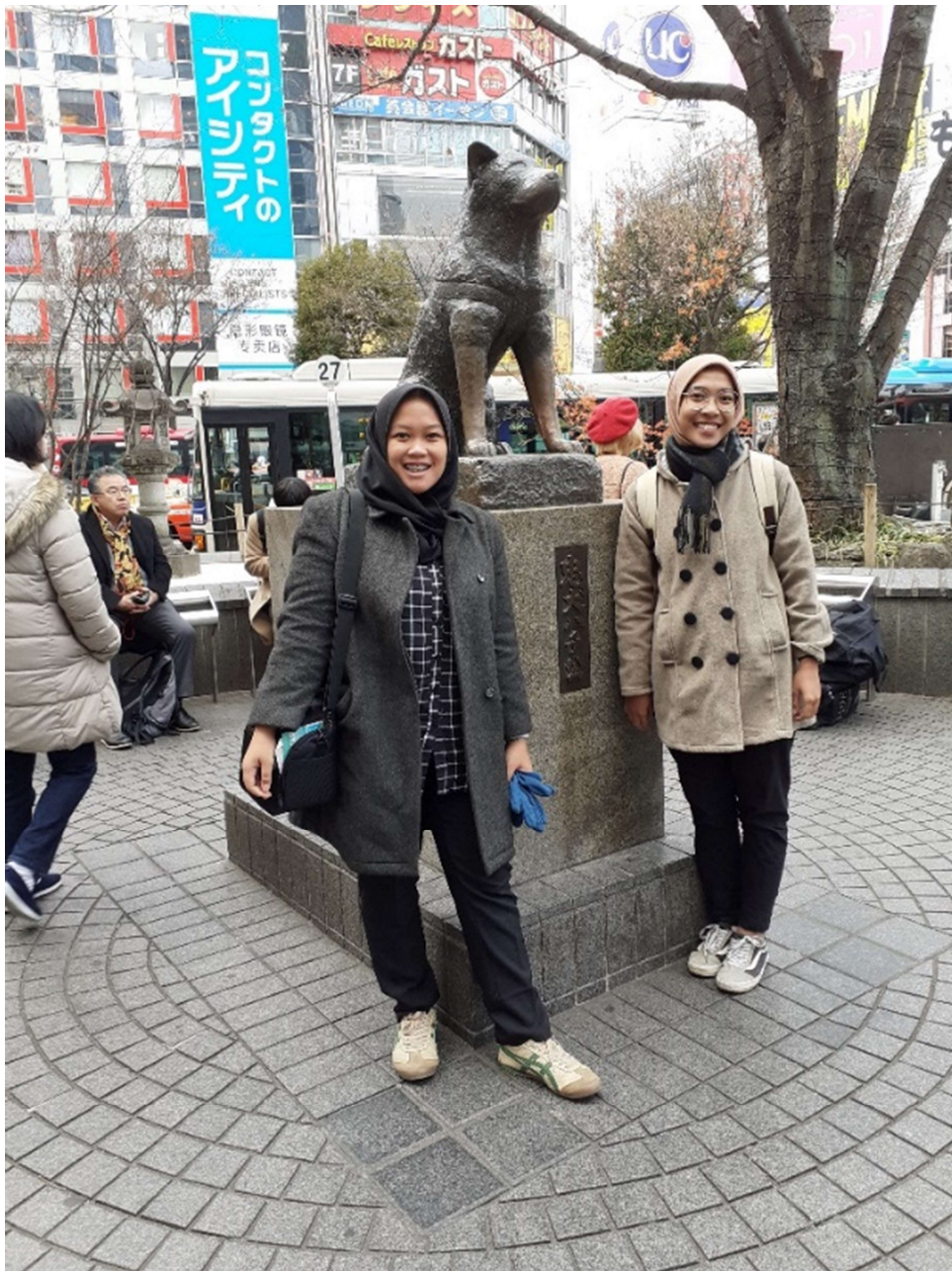
Tahun berapa ya “hachiko” ini...sekitar tahun 1924 deh

Sampai Shibuya Eki keluar lewat pintu yang terkenal dengan legenda Hachiko (itu lho....anjing yang terkenal banget dengan kesetiaan terhadap tuannya)...photo-photo dikit deh