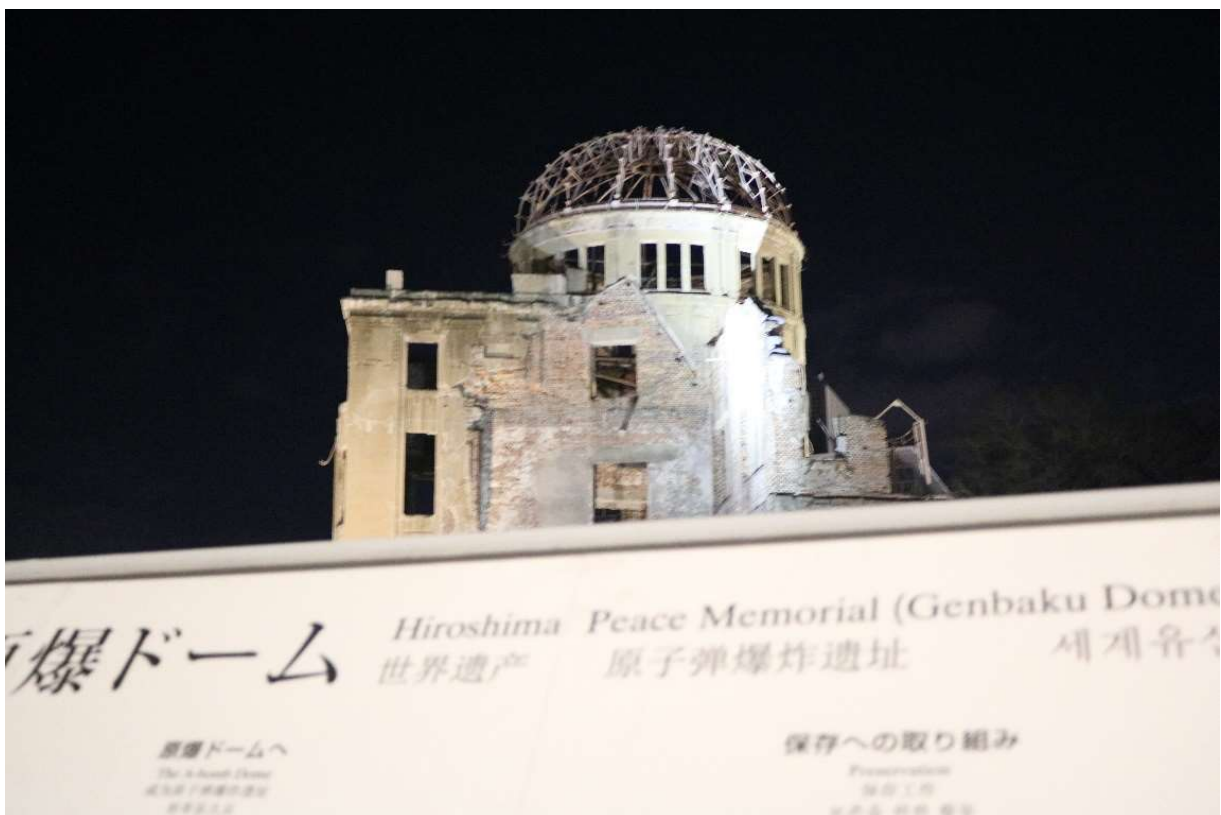
Gedung ini dulunya adalah kantor Departemen Perindustrian Jepang, sekarang jadi museum

Photo-photo sebentar di Hiroshima Atomic Bomb