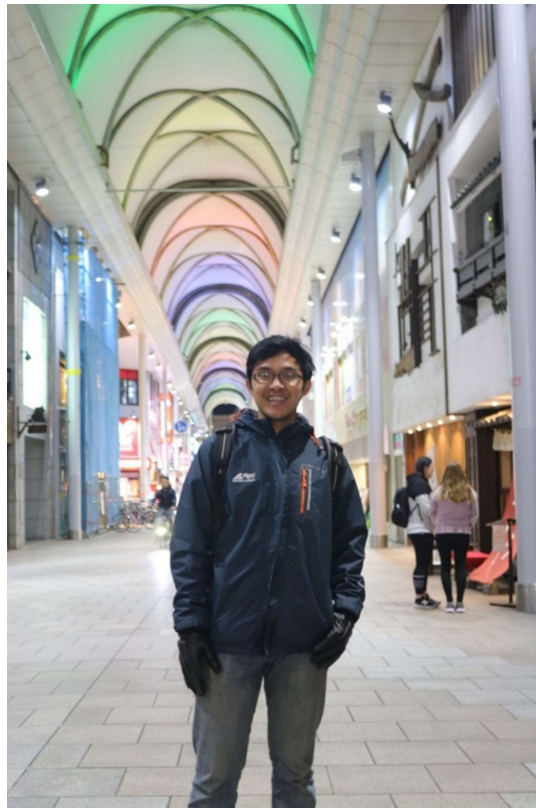
Sebagian besar toko sudah tutup...

Photo-photo sebentar di Hiroshima Atomic Bomb