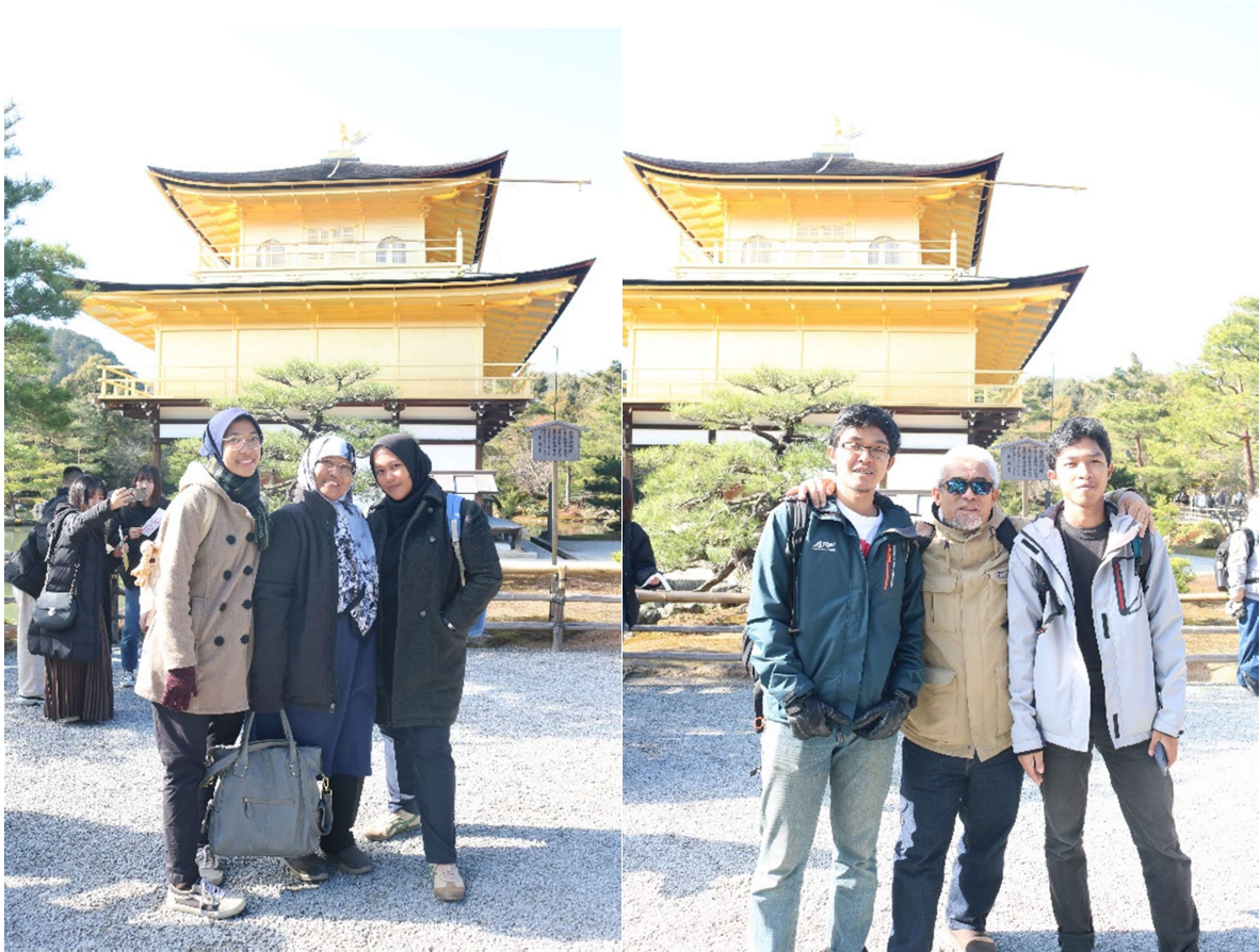
Background Kinkakuji.....luar biasa.....