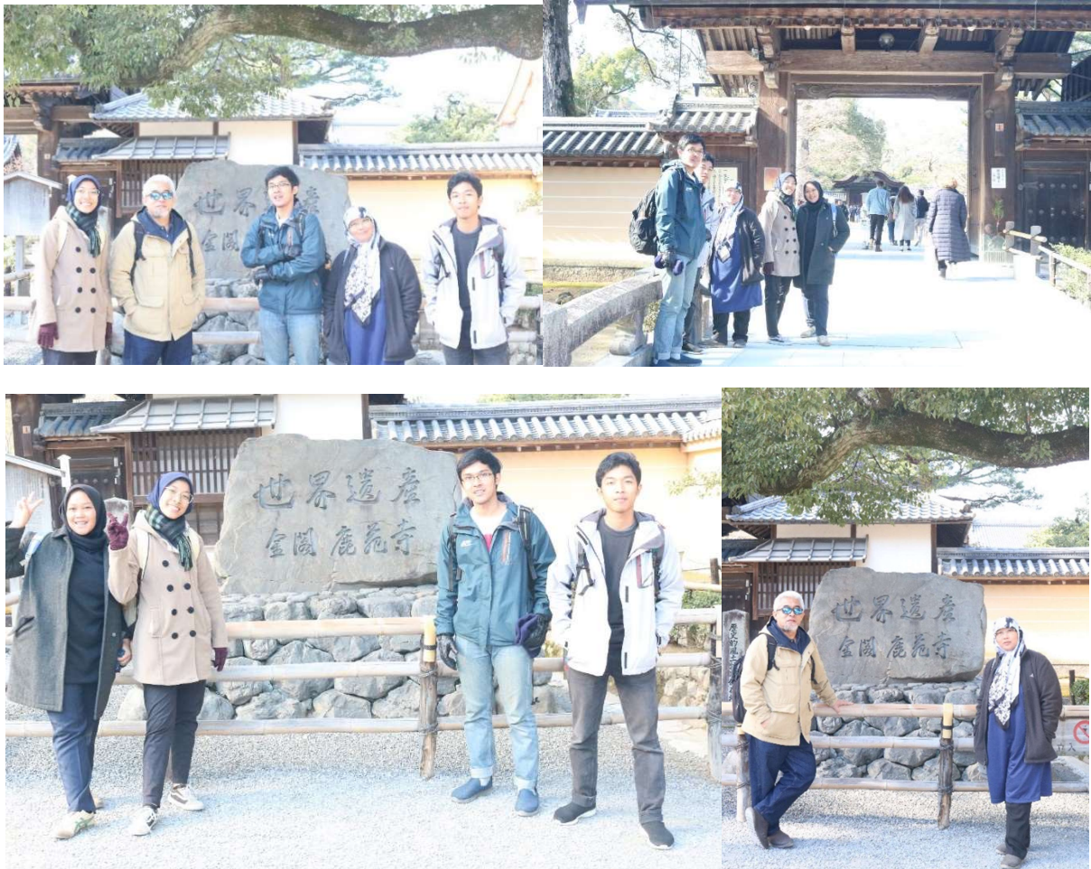
Pintu masuk kinkakuji

Sampai Kyoto jam 10.17....Nitip koper dulu di Stasiun (bayar 500 yen) ...dari track Shinkansen pindah jalur ke JR ... Gate 32... Giri – giri dong....kereta berangkat jam 11.12....sampe Sta Emmachi kira – kira 9 menit....keluar stasiun Emmachi belok kanan....nemu persimpangan belok kiri....ketemu deh halte bisnya. Naik bis No. 204 atau 205 ke kuil Kinkakuji. Semua petunjuk sih jelas...Cuma biar cepet kita tanya aja ke petugas di stasiun, jadi masih kepeke juga Bahasa Jepangnye.