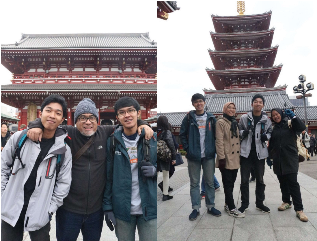
Luar biasa pengunjungnya...mungkin karena hari Minggu juga