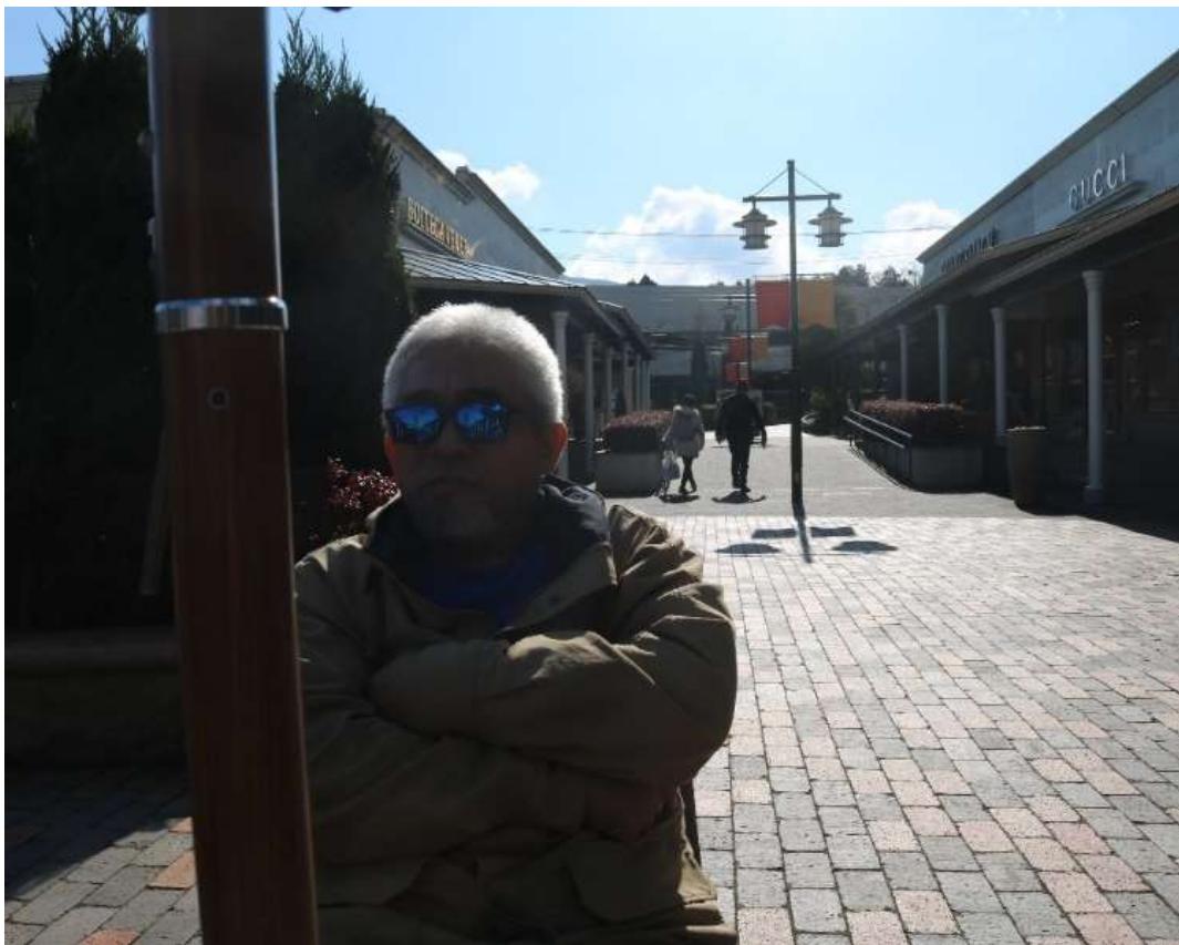
Factory Outlet – GOTEMBA, catet yeee....

Jam 12.30 berangkat ke Yetti Snow Town, naik busnya dr factory outlet, lumayan juga tiket busnya, 1.190 yen/orang.